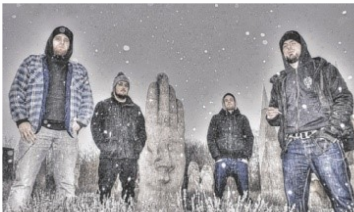
UFG feiern am Hofkirchen Rock City ihr 20-jähriges Bestehen.

Außerdem feiern die Metal-Urviecher von UGF ihr 20-jähriges Bestehen. Die vier Jungs aus Bayern und Österreich haben quasi Heimspiel und wollen dieses ordentlich nutzen. Den Festivauftritt bestreiten The Dirt aus Passau. Neben dem starken Line-Up legt das Festival Wert auf regionale Produkte und eine nachhaltige Festivalwirtschaft. Seit 2017 wird das HRC